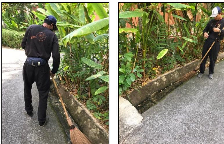
รูปภาพที่ 2.5 การทำความสะอาดรางระบายน้ำ/ท่อระบายน้ำ