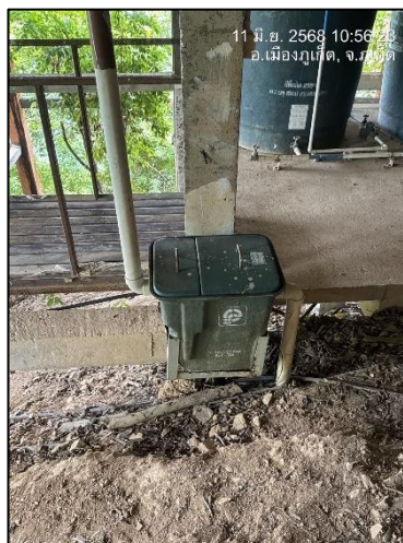
รูปภาพที่ 2.2 ระบบบำบัดน้ำเสียสำเร็จรูปของโรงแรม