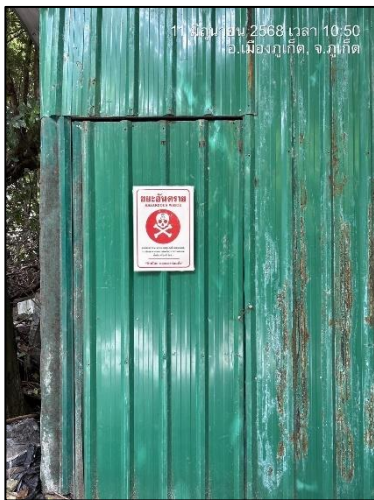
รูปภาพที่ 2.10 จุดรวบรวมขยะอันตราย