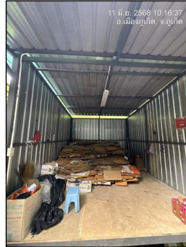
รูปภาพที่ 2.9 โรงคัดแยกขยะ