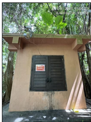
รูปภาพที่ 2.6 ห้องพักรวม