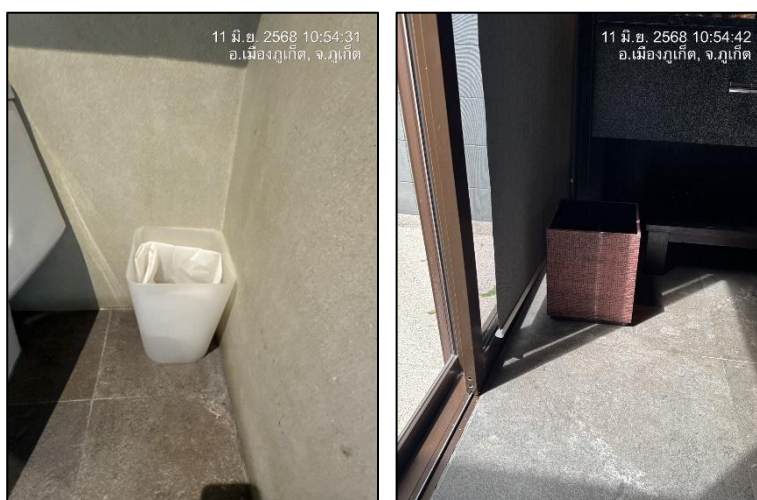
รูปภาพที่ 2.7 ถังขยะมูลฝอยภายในโรงแรม