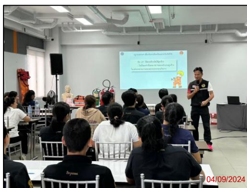
รูปภาพที่ 2.13 อุปกรณ์ป้องกันและแจ้งเตือนอัคคีภัย