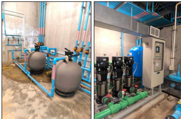
รูปภาพที่ 2.15 การตรวจสอบเส้นท่อจ่ายน้ำ