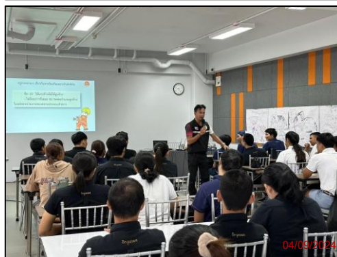
รูปภาพที่ 2.14 ซ้อมอพยพหนีไฟ