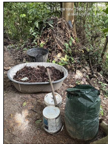
รูปภาพที่ 2.11 จุดทำปุ๋ยหมักชีวภาพ