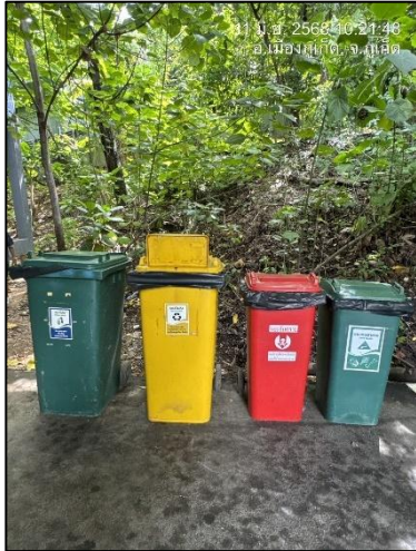
รูปภาพที่ 2.8 ถังขยะแยกประเภทของโครงการ