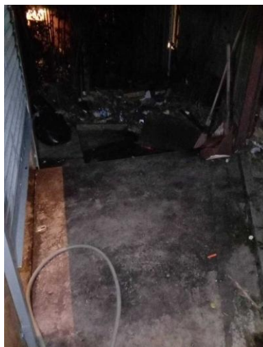
รูปภาพที่ 2.12 การล้างทำความสะอาดห้องพักขยะรวม