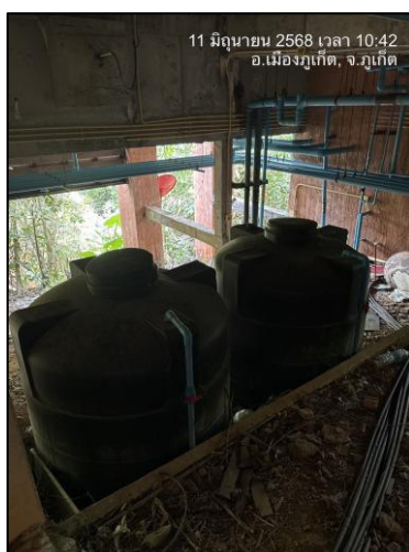
รูปภาพที่ 2.3 ถังเก็บน้ำสำรอง