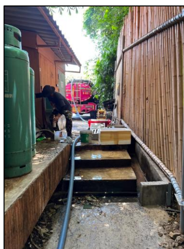
รูปภาพที่ 2.4 การสูบน้ำ/ไขมัน